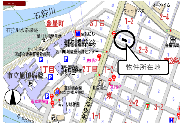
近くに複数台数置ける駐車場あり！