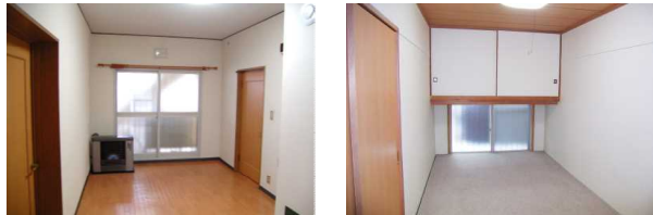
天井が高いためお部屋が広く感じられます