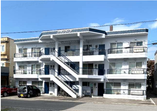
外壁塗装完了し、きれいになりました！