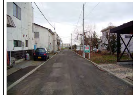
北西隣地より撮影