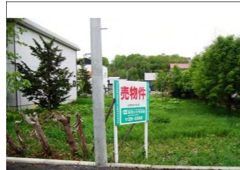
南東道路側より撮影