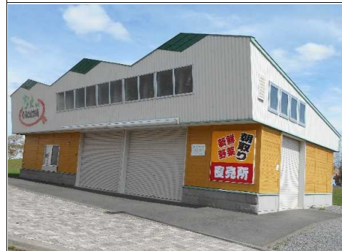
びえいふるさと市場