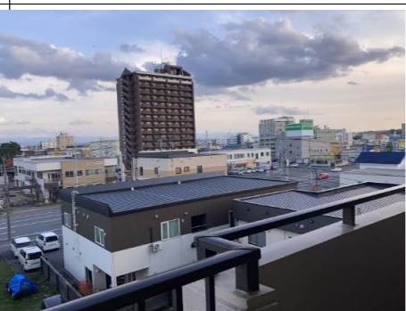
バルコニーからの眺め